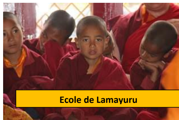
Ecole de Lamayuru