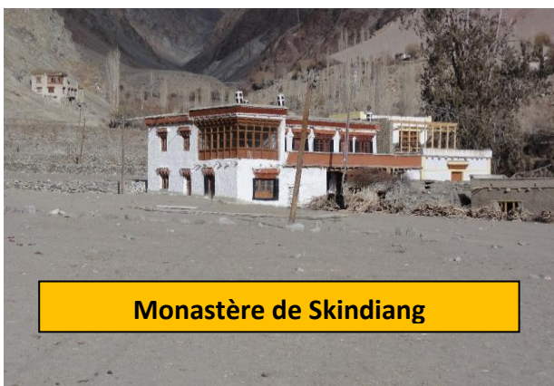
Monastère de Skindiang