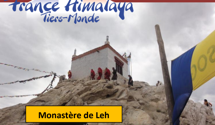
Monastère de Leh