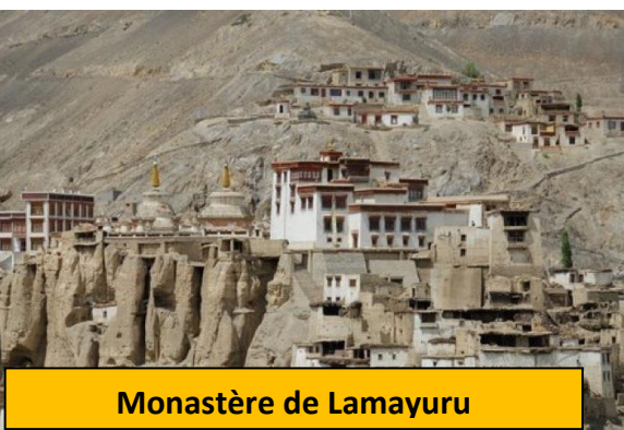
Monastère de Lamayuru