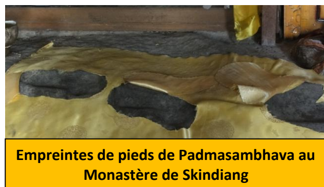
Empreintes de pieds de Padmasambhava au Monastère de Skindiang